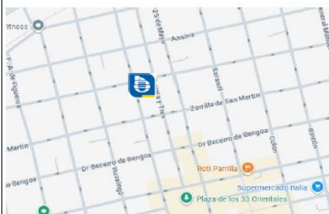
PLANO DE LA MICROZONA